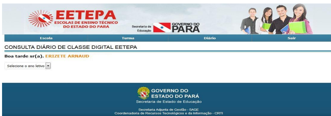
Tela 02. Seleciona ano letivo