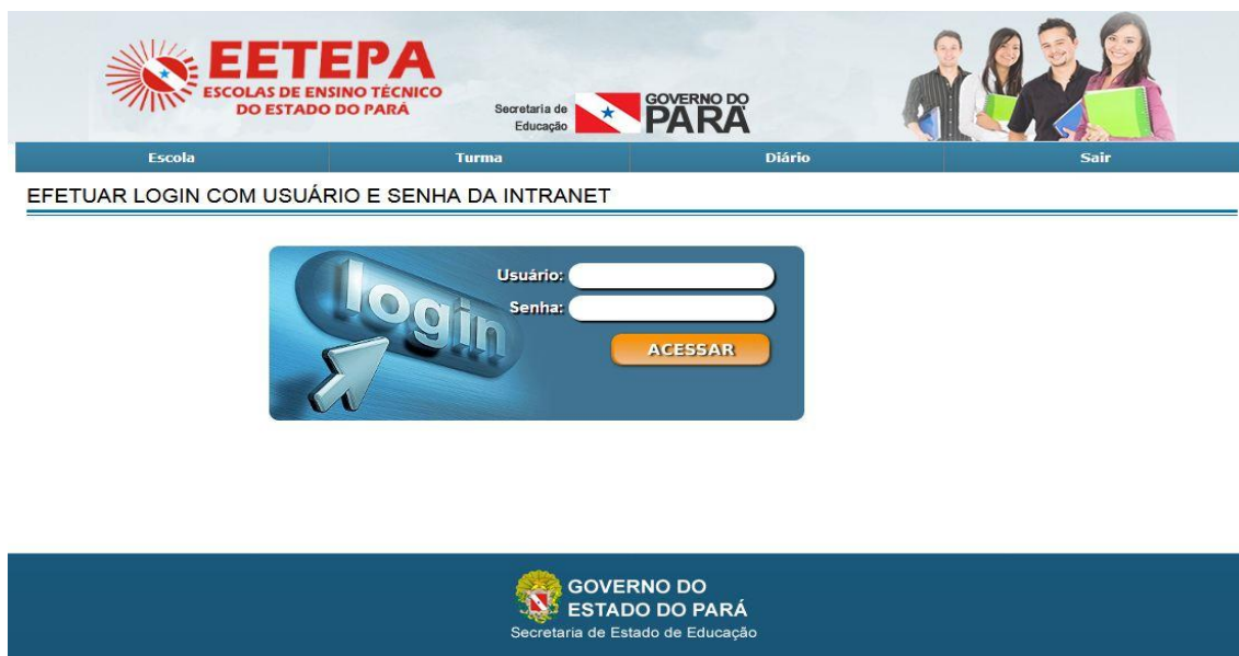
Tela 01. Autentica usuário