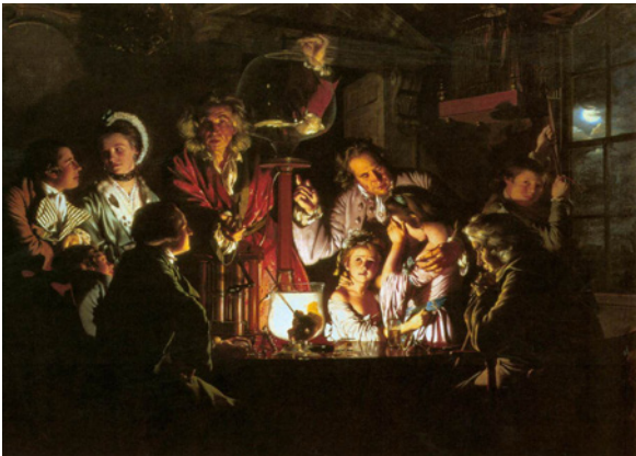
WRIGHT OF DERBY, Joseph. .Experiência com um Pássaro na Bomba de Ar. 1768. 1 óleo sobre tela, 183 cm x 244 cm. The National Gallery, Londres.

O Iluminismo é frequentemente apresentado como um movimento intelectual que valorizava a razão, criticava o absolutismo e defendia direitos naturais, mas uma análise mais cuidadosa revela que não se tratou de um conjunto homogêneo de ideias, e sim de um campo plural, marcado por divergências e diferentes apropriações históricas. Entre seus princípios mais recorrentes destaca-se a noção de que o poder político deve se basear na vontade coletiva, expressa na crítica às monarquias absolutas e à legitimação do poder pela tradição ou herança dinástica. Havia ainda