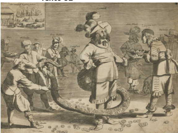
caricatura holandesa de 1658, intitulada O Horrível Homem-Rabo.

As imagens foram produzidas no contexto da guerra civil na Inglaterra, ambas destacam o poder de Oliver Cromwell, porém apresentam sentidos diferentes respectivamente de: