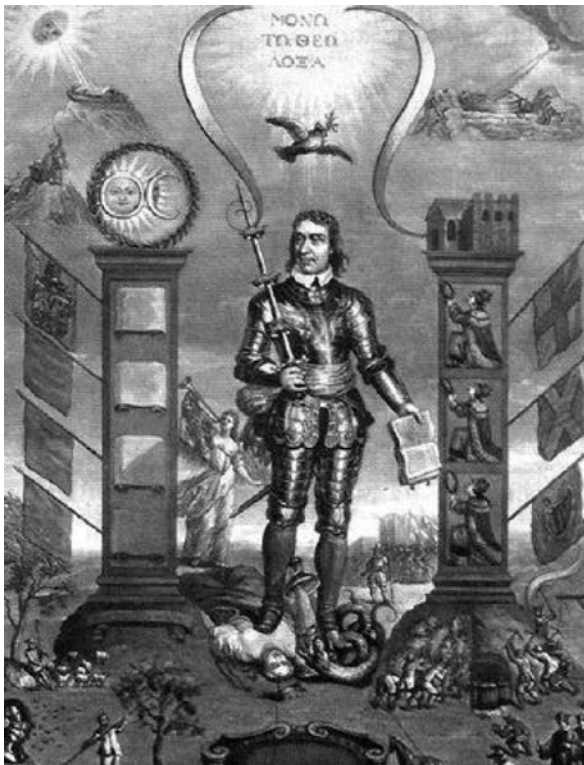
Oliver Cromwell as Christ, c1650s