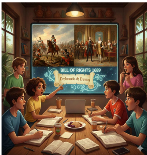
Estudantes e a Declaração de Direitos

instauração de uma ditadura republicana. O desfecho foi marcante: o rei Carlos I foi julgado e decapitado por traição.