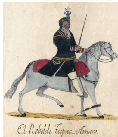
MARTÍNEZ COMPAÑÓN, Baltasar Jaime. El Rebelde Tupac Amaro . [ca. 1782-1785]. 1 figura. Disponível em: https://www.cervantesvirtual.com . Acesso em: 30 dez. 2025. Visão colonial do líder de rebelião popular na América espanhola

movimentos de independência. Já a maioria da população era formada por indígenas, negros escravizados ou libertos e mestiços, que lutavam por melhores condições de vida, como o fim da escravidão, dos tributos e da exploração. As mulheres também participaram, atuando como mensageiras, organizadoras, apoiadoras das lutas, entre outros papéis. Embora marcadas pela diversidade, os movimentos de emancipação colonial também faziam parte de um contexto maior.