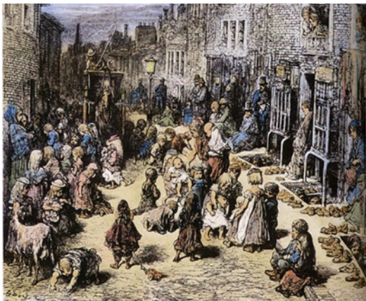
DORÉ, Gustave. Orange Court, Drury Lane. In: JERROLD, B. London: a pilgrimage, 1872. Xilogravura colorizada digitalmente. representação da precariedade das moradias dos operários ingleses.

“O mundo que hoje conhecemos é filho da Revolução Industrial”. Essa frase, escrita pelo historiador Luís Moraes, nos ajuda a compreender que as profundas transformações ocorridas nos modos de produção também alteraram, de forma decisiva, os modos de vida das pessoas - impactos que ainda hoje fazem parte do nosso cotidiano. Iniciado no final do século XVIII, esse processo histórico provocou mudanças duradouras na forma como o trabalho passou a ser organizado, na circulação das mercadorias e no uso das tecnologias nos mais diversos setores da sociedade, dos meios de transporte às atuais inteligências artificiais.